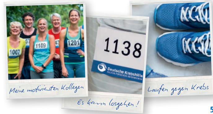
Meine motiviertesten Kollegen