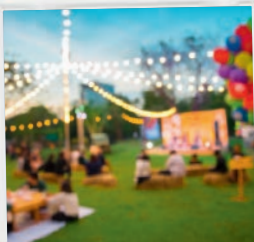
Party in Malente