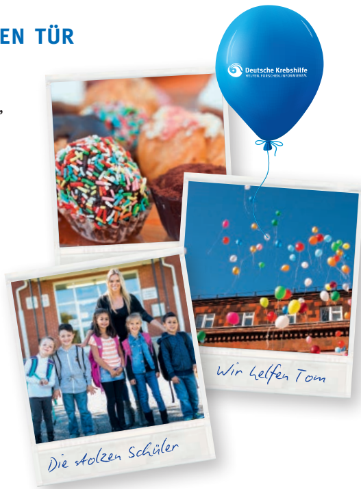
Die stolzen Schüler